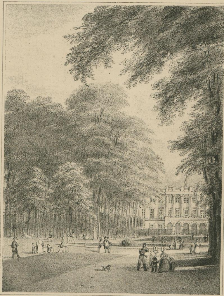
LE PARC A 2 HEURES. ALLÉE CENTRALE ET PALAIS ROYAL. D'après la lithographie de Borremans et Baugniet.

ministre de l'intérieur fut reconstruit après 1830. Il avait été brûlé dans les journées de septembre par un corps de volontaires, afin de chasser du palais de la Nation, alors palais des États généraux, les troupes hollandaises qui s'y étaient réfugiées. Le ministère de la justice et le ministère des travaux publics, qui n'avait été créé qu'en 1837, avaient leurs locaux, l'un rue de la Régence, dans un vieil hôtel que